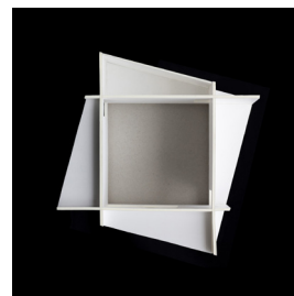
AGW_UnfertigeHaeuser_WS02 Wohnskulptur 02t