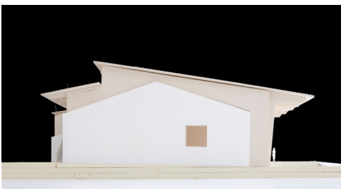
AGW_UnfertigeHaeuser_Ingerkingen Mehrzweckhalle Ingerkingen