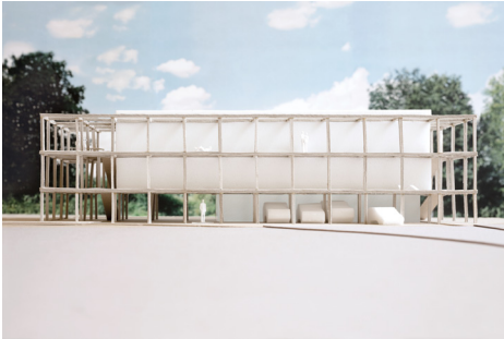
AGW_UnfertigeHaeuser_Wohnheim Wohnheim für Geflüchtete