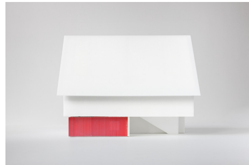
AGW_UnfertigeHaeuser_Hoinka Haus Hoinka, Pfaffenhofen