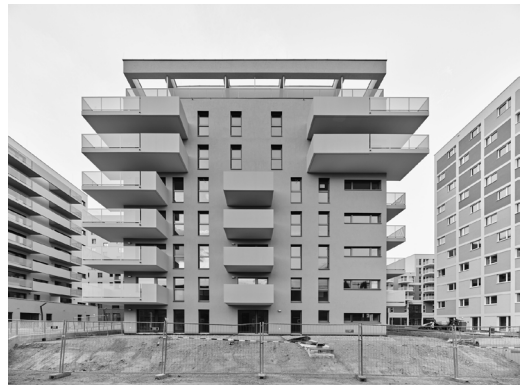
AGW_Versatzstuecke_Wormbs_GraueEnergie2 Valentin Wormbs: ‚Bruno-Marek-Allee, 10. Bezirk‘, aus der Serie ‚Graue Energie – Wien 2022‘. Inkjetprint 60 × 80 cm. © Valentin Wormbs