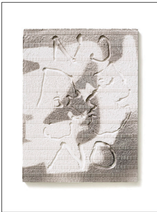
AGW_Versatzstuecke_Braun_OT_2 Harald Braun: ‚Ohne Titel‘ 2022. Gusskeramik Metallic-Autolack, 30 × 40 × 3 cm. © Harald Braun