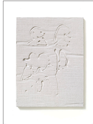
AGW_Versatzstuecke_Braun_OT_3 Harald Braun: ‚Ohne Titel‘ 2022. Gusskeramik 30 × 40 × 2,4 cm. © Harald Braun