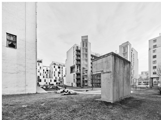
AGW_Versatzstuecke_Wormbs_GraueEnergie3 Valentin Wormbs: ‚Vorgartenstraße, 10. Bezirk‘, aus der Serie ‚Graue Energie – Wien 2022‘. Inkjetprint 60 × 80 cm.