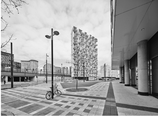
AGW_Versatzstuecke_Wormbs_GraueEnergie1 Valentin Wormbs: ‚Gombrichgasse, 10. Bezirk‘, aus der Serie ‚Graue Energie – Wien 2022‘. Inkjetprint 60 × 80 cm.