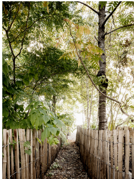
AGW_ARAB_Respiration_2.jpg KW-Garten, Berlin