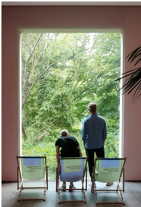
AGW_ARAB_Respiration_1.jpg Garten Hamburger Bahnhof, Berlin @ atelier le balto