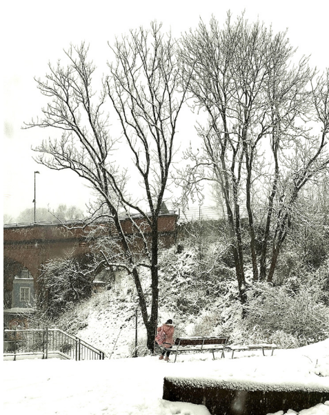
AGW_ARAB_Respiration_3.jpg Nachbarschaftspark BOB CAMPUS, Wuppertal @ atelier le balto